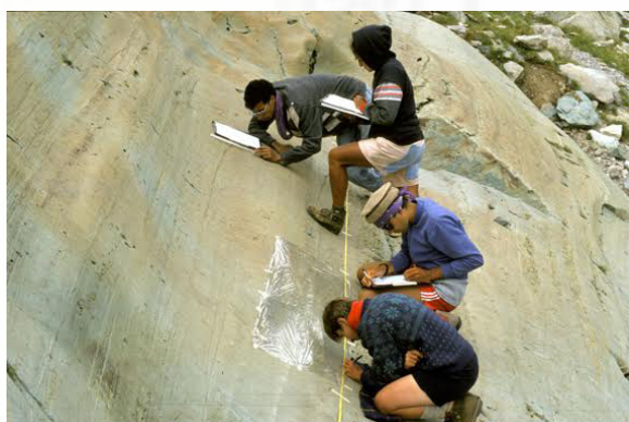
Chantier de relevés de gravures rupestres du Mont Bego

Il conserve dans ses réserves l'ensemble du matériel de faunes quaternaires et d'industries lithiques acheuléennes issu des fouilles, sur le site.