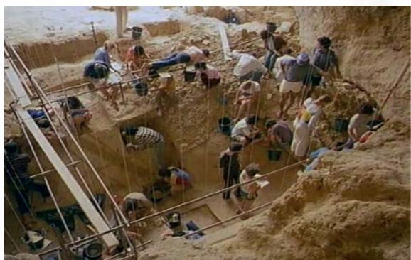
Chantier de fouilles de la Caune de l'Arago