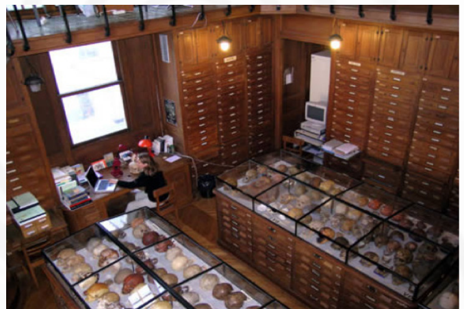
La salle des crânes