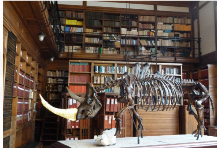
Le rhinocéros laineux