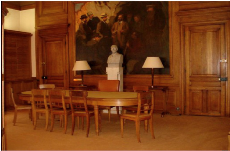
Le bureau du Professeur Henry de Lumley